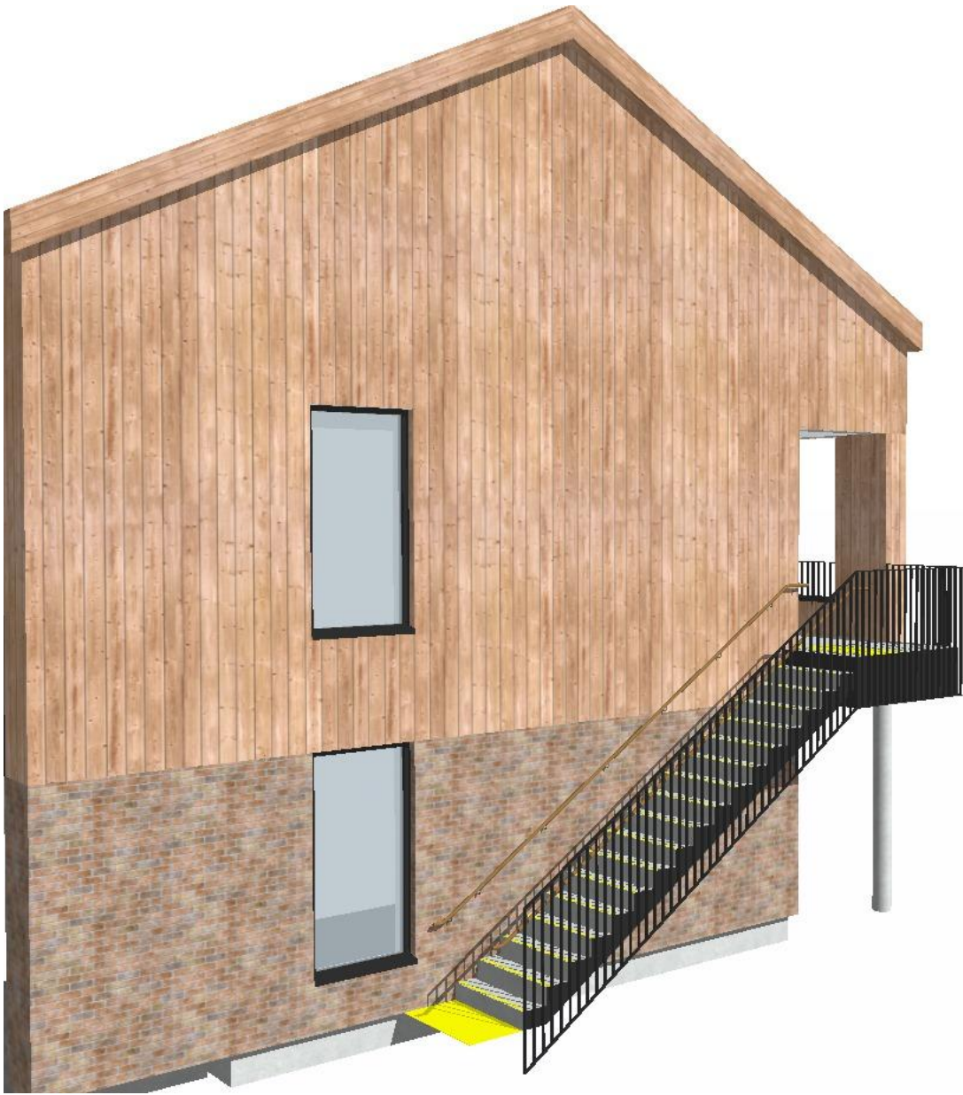
3d utvendig trapp bygg A